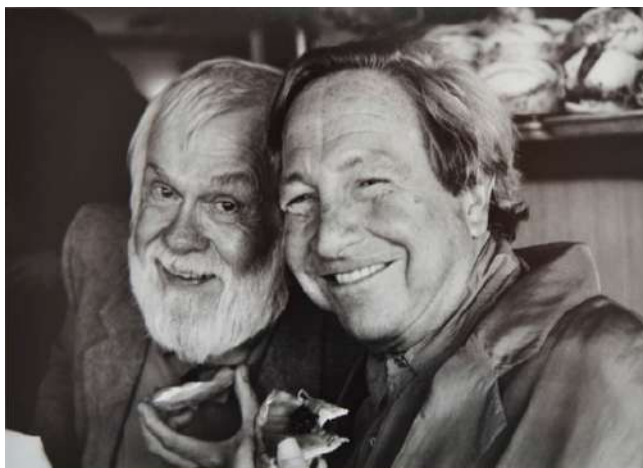
John Baldessari y Robert Rauschenberg, 1992

Tituladas Foot and Stocking , las serigrafías coloristas editadas en 2010 fueron realizadas a partir de fotografías del pie derecho de varios miembros del personal de su estudio. Luego modificó digitalmente cada imagen cubriendo todo el pie, excepto el dedo gordo derecho, con un plano negro que es de hecho un tejido que simula un calcetín. Esta idea de esconder o mostrar fragmentos específicos del cuerpo la enlaza con las series Nose/Silhouette (2010) y Noses & Ears (2007), en las que entramos en uno de los terrenos favoritos del artista.