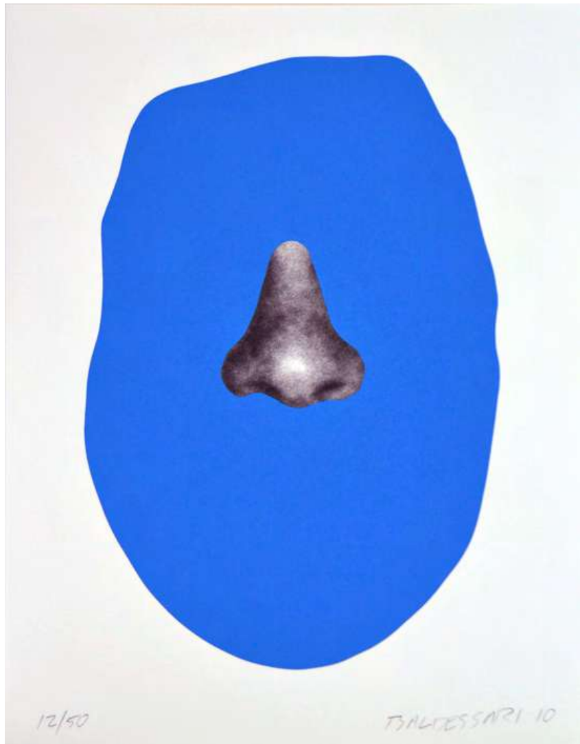
John Baldessari Nose/Silhouette: Blue 2010 Litografía y serigrafía 46 x 35 cm Edición 50 ejemplares Ref. 060024