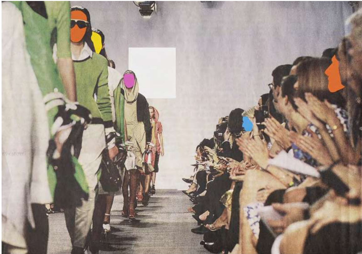
ELDERLY WOMAN SLICING APPLE WITH MIDDLE-AGED MAN LOOKING OVER HER SHOULDER