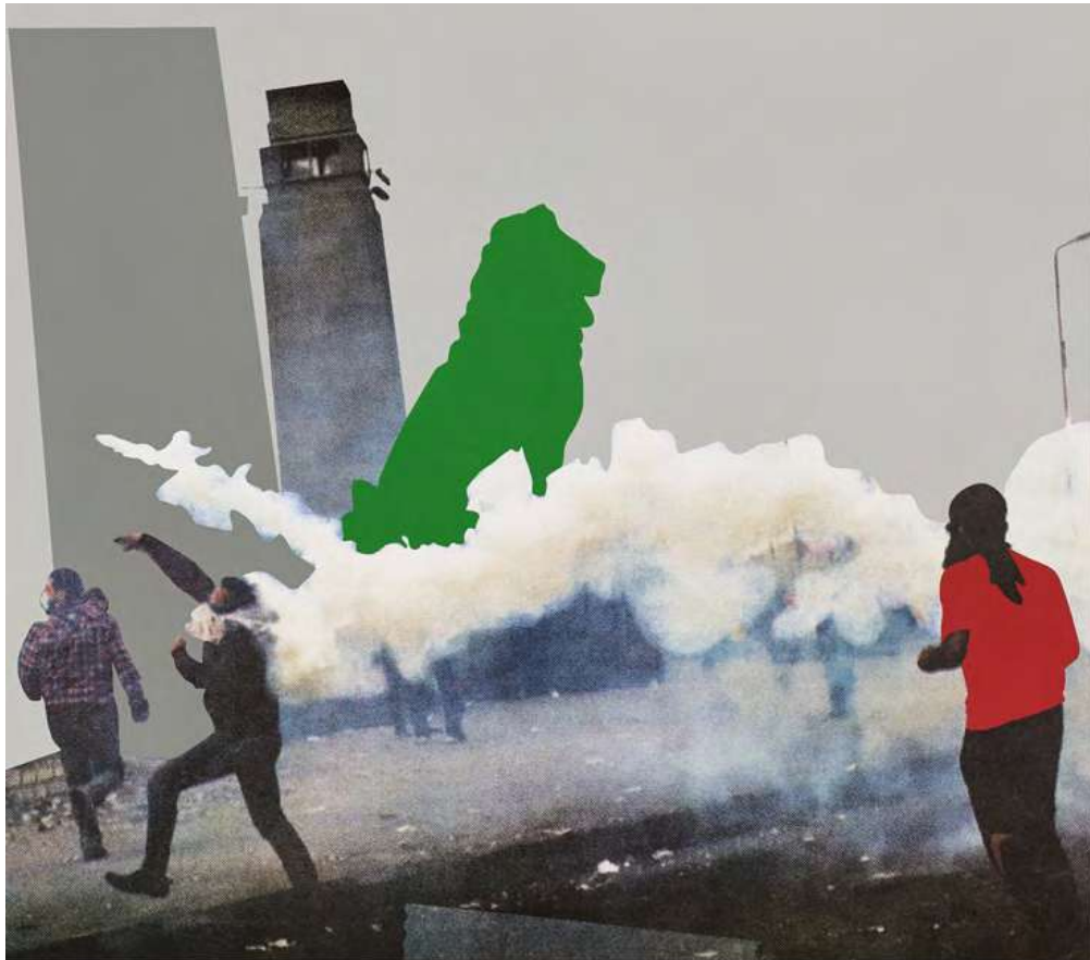
THREE MEN LEAVING HOUSE (FLOWER PLANTERS NEAR DOOR)