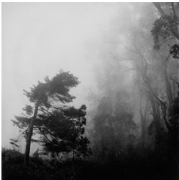
Monterrey Pine in the Fog. California, 2013

Esta técnica se desarrolló a finales del siglo XIX para poder reproducir múltiples copias de fotografías. Tuvo un gran apogeo en las primeras décadas del siglo XX y se utilizó en publicaciones e importantes revistas como Camera Work , dirigida por Alfred Stieglitz. Sin embargo, la llegada de nuevas y más baratas tecnologías, como el offset , hicieron que el cuidadoso y, por lo tanto, más caro proceso del heliograbado no pudiera competir comercialmente. Sin embargo, la singularidad y calidad de las imágenes obtenidas con heliograbado ha llevado a algunos artistas contemporáneos a escoger esta técnica para imprimir sus imágenes.