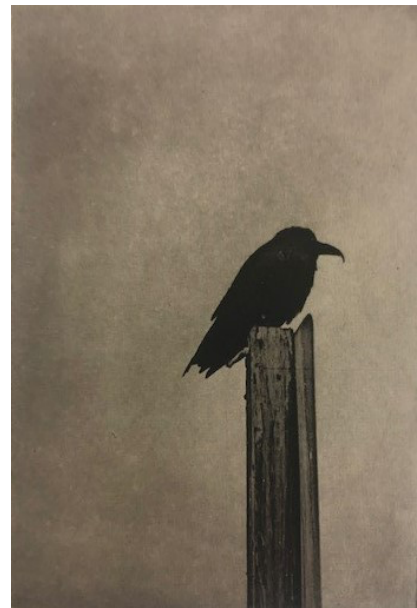
Black Bird on post. California, 2007